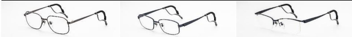
左から MYD の 1001、1002、1003