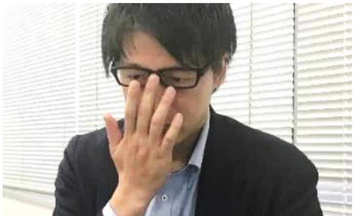
左) パソコンの長時間使用で乱れがちな姿勢 右) 中指の“メガネ上げ”作業のストレスから解放