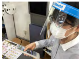
検査測定時、スタッフのフェイスシールド着用。