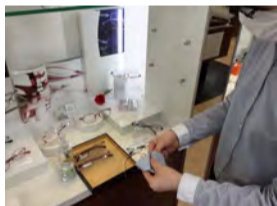
展示商品の除菌及び、店内の定期的な清掃。

店内は安心してご来店いただけるよう 安全対策に全力で取り組み、引き続き運営してまいります。