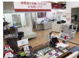
対面接客テーブルに飛沫感染防止カーテン設置。