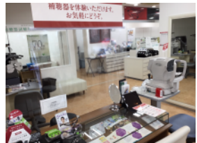
対面接客テーブルに飛沫感染防止カーテン設置。