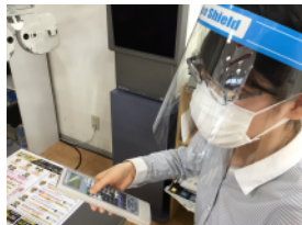
検査測定時、スタッフのフェイスシールド着用。