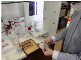
展示商品の除菌及び、店内の定期的な清掃。

店内は安心してご来店いただけるよう 安全対策に全力で取り組み、引き続き運営してまいります。