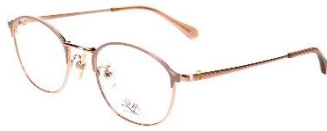
パーソナルカラーで選ぶ 華色