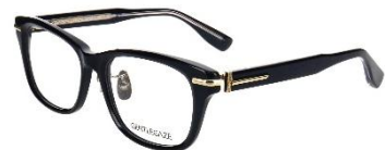
知的なメンズメガネ GENTLEGAZE