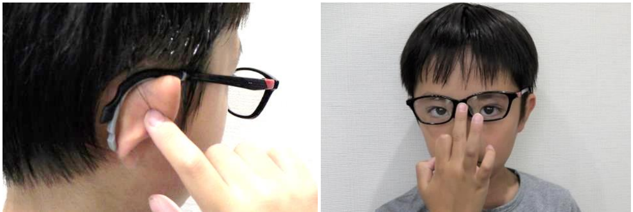
耳に巻き付く独自のフレーム形状で、しっかりとフィット！(左) 勉強中や運動中のメガネの“ズレ”をなおす、中指のあの仕草よ、さらば！(右)