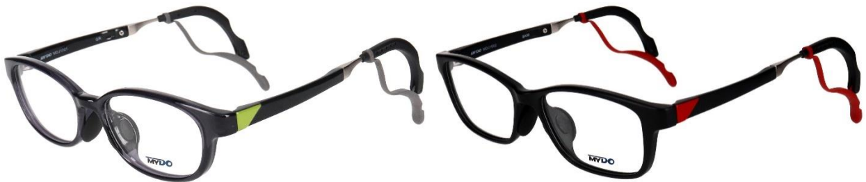
横長楕円形の定番オーバルタイプ「MDJ-1001」(左)、シャープな形のスクエアタイプ「MDJ-1002」(右)