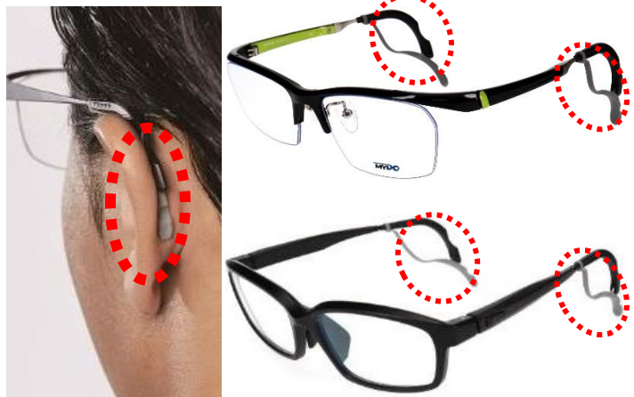
(上)広い視野を確保するハーフリムタイプ…ゴルフや登山に (下)太いフチで、丈夫なフルリムタイプ…テニスやマラソンに

メガネバンドを使わなくても、耳に吸い付くようにしっかりとフィットするので、走ったり、激しく動いたり、汗をかいても、ずり落ちません。常に正しい掛け位置にキープし、ピントと視界を良い状態で保つため、スポーツを快適に楽しめます。