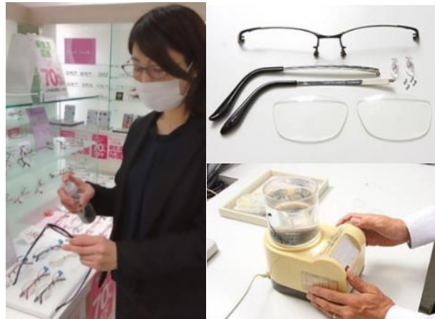
メガネを完全分解し、超音波洗浄。仕上げに除菌スプレー

まず、お客様のメガネの全てのネジを外し、分解してから、付着した汚れを超音波洗浄機で洗い流します。その後、除菌効果のある「次亜塩素酸水(弱酸性)」のスプレーを全体に噴霧し、レンズのコートを守るクリーナーを塗って拭き上げた後、くもり止めを塗布します。