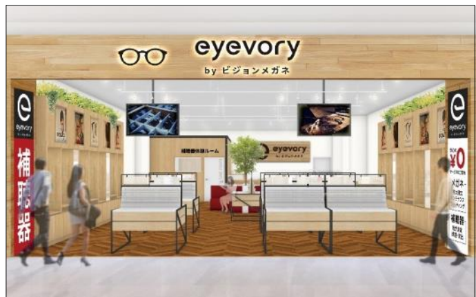
木目調でナチュラルな空間、優しい雰囲気 店内通路を広くして回遊性を高めた、ゆとりある店内

また密を避けられるよう、店内の通路幅を広くとり、ベビーカーや車椅子を利用される方でもゆとりを持って回遊しやすくします。