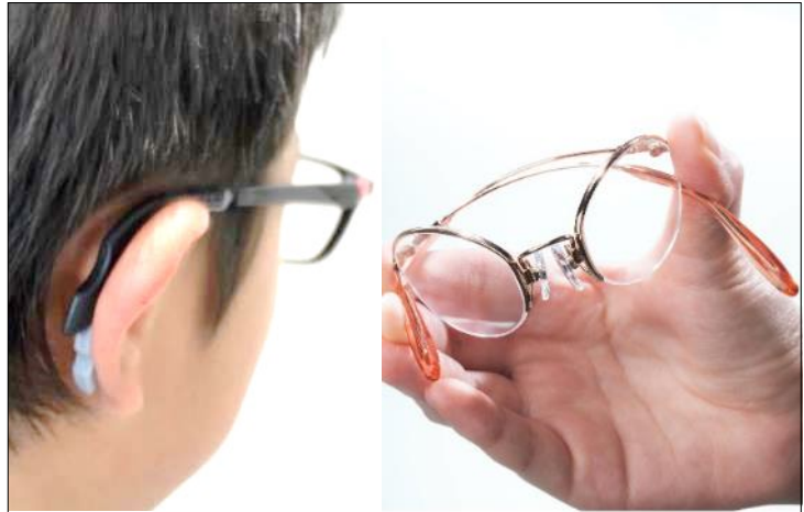
(左) 人気 YouTuber も「絶対落ちない」と大絶賛の「マイドゥ」 (右) 柔軟性抜群で一日中掛けても疲れのない形状記憶メガネ ビジョンメガネの大ヒット商品「ケータイフレックス」

また、川口エリアに初登場する「アイシー！ベルリン」や、川口エリア最大級のラインアップが勢揃いする、芸能人にも愛用者の多い「トニーセイム」といった、グローバルブランドも揃えます。