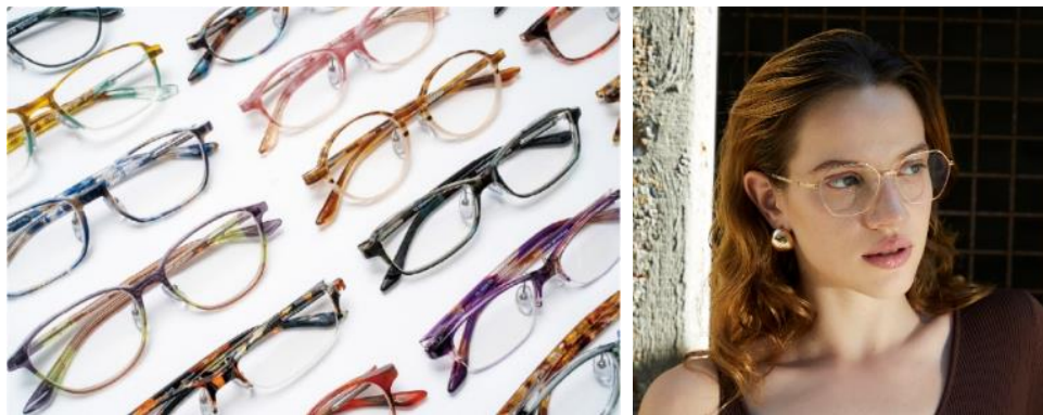
(左) 「tonysame(トニーセイム)」…日本を中心としたアジアの魅力を世界に発信するグローバルブランド 川口エリア最大級の商品本数！ (右) 「ic! berlin(アイシー！ベルリン)」…川口エリアに待望の初登場！ 工具を一切使わずに、全てのパーツを手で、分解・組み立てることができる構造と斬新なデザインが魅力