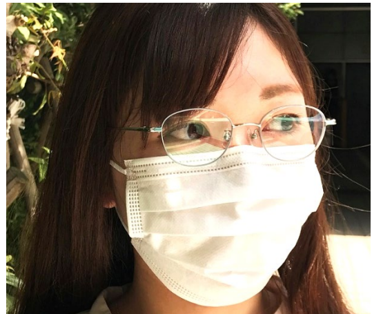
細いフレームで顔なじみが良いので、マスク着用時に暗くなりがちな顔周りをぱっと明るく

カラーは、ナチュラルな美しさを引き立てるピンク、落ち着いた印象のゴールド、上品な“大人女性”の魅力を引き立てるグレーマットの3色です。