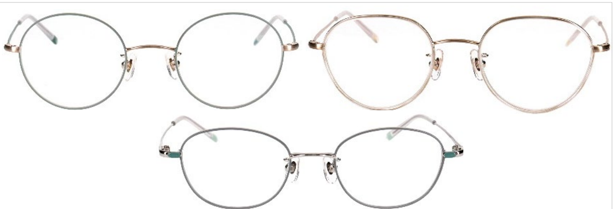
(左上)「Emily」…定番のラウンドタイプ。オリーブはどんな色のファッションやメイクにも合わせやすい万能カラー (右上)「Daisy」…トレンドのクラウンパントタイプ。イチオシのアイボリーは、肌の色になじみやすく、使いやすい1本 (下)「Lily」…クールな印象のスクエアタイプ。フレームの目元部分にアクセントで七宝を施し、凛としたイメージに