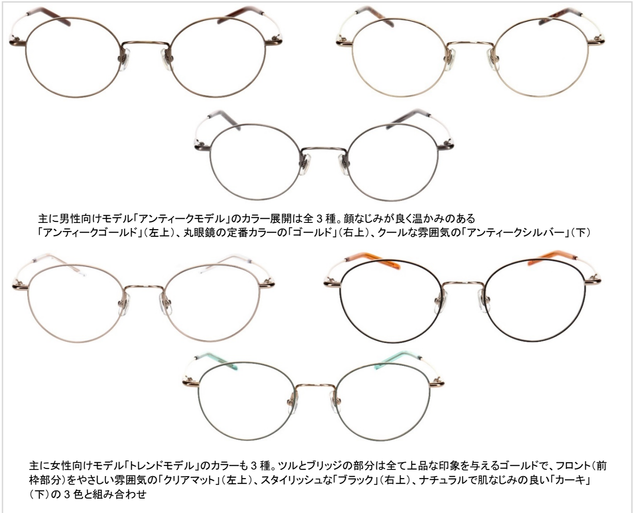
主に男性向けモデル「アンティークモデル」のカラー展開は全3種。顔なじみが良く温かみのある「アンティークゴールド」(左上)、丸眼鏡の定番カラーの「ゴールド」(右上)、クールな雰囲気「アンティークシルバー」(下)

長時間のデスクワークでも疲れづらく、ストレスフリーなので、在宅ワークや自宅で過ごす時間に最適です。