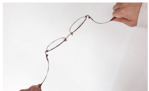
ツルを広げても、フレームがゆがんだり、折れたりもせず、形をしっかりキープ金属なのに、“やわらかフレーム”！