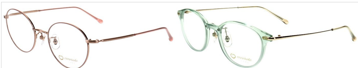
女性に人気のボストン型。クラシカルなデザインで“おしゃれ感”を演出 (左)前枠がメタルの品番「サラ(Sara)」は、レンズの横幅が44mmとトレンドの少し大きめサイズで小顔効果も (右)品番「エマ(Emma)」は、前枠のアセテートが目元のアクセントになり、メイクをしたようにお顔の印象アップ！

ベージュやピンクベージュ、グリーン、パープルといった肌なじみに優れた、トレンドの“ニュアンスカラー”(曖昧な中間色)と、目元の印象を引き立てるアクセントカラーのブラウンササをラインアップします。