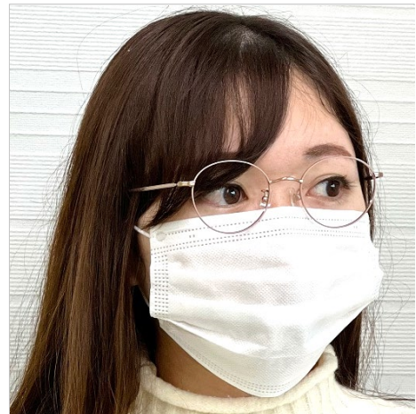
まだまだ続くマスク生活に… 細身のフレームと肌なじむカラーリングで マスク着用時もぱっと華やかな印象に